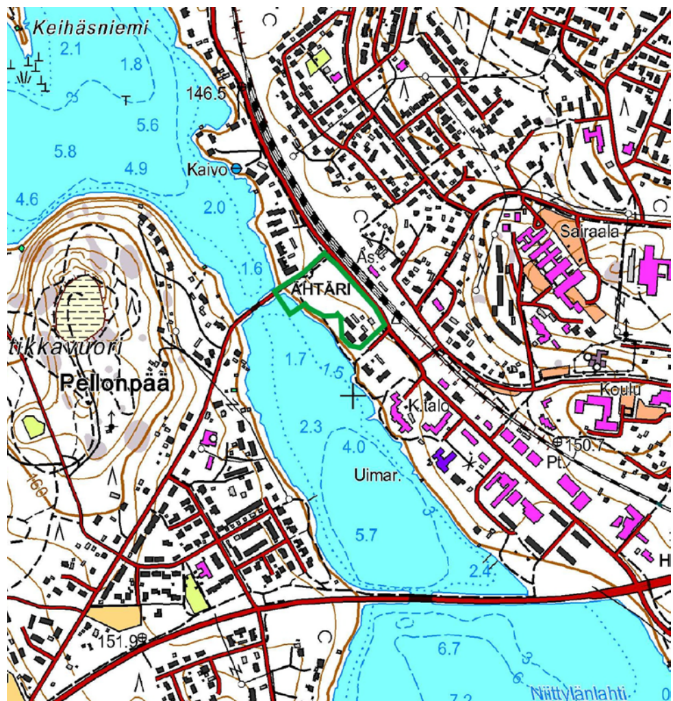
Kuva 1. Alueen sijainti

Suunnitelman nimi on KESKUSTAAJAMAN ASEMAKAAVAN MUUTOS, korttelit 14 ja 15. Suunnittelualue sijaitsee Ähtärin keskustassa Meijeritien ja Ostolantien välisellä alueella. Alue rajautuu lännessä Ouluveteen. Suunnittelualueen laajuus on noin 2,3 ha. Alueen sijainti on esitetty kuvassa 1 ja rajaus kuvassa 2.