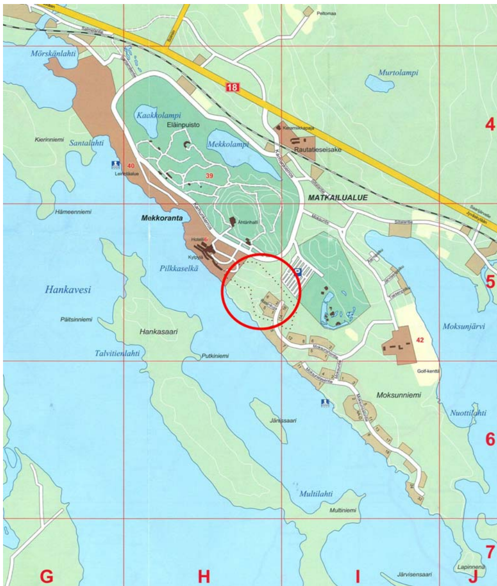
Kuva 1. Suunnittelualueen sijainti

Suunnitelman nimi on MOKSUNNIEMEN ASEMAKAAVAN MUUTOS HOTELLI MESIKÄMMENEN ITÄPUOLISILLA ALUEILLA. Suunnittelualue sijaitsee noin 8 km päässä Ähtärin keskustasta Moksunniemen loma- ja matkailualueella. Suunnittelualueen laajuus on 16,9 ha. Alueen sijainti on esitetty kuvassa 1.