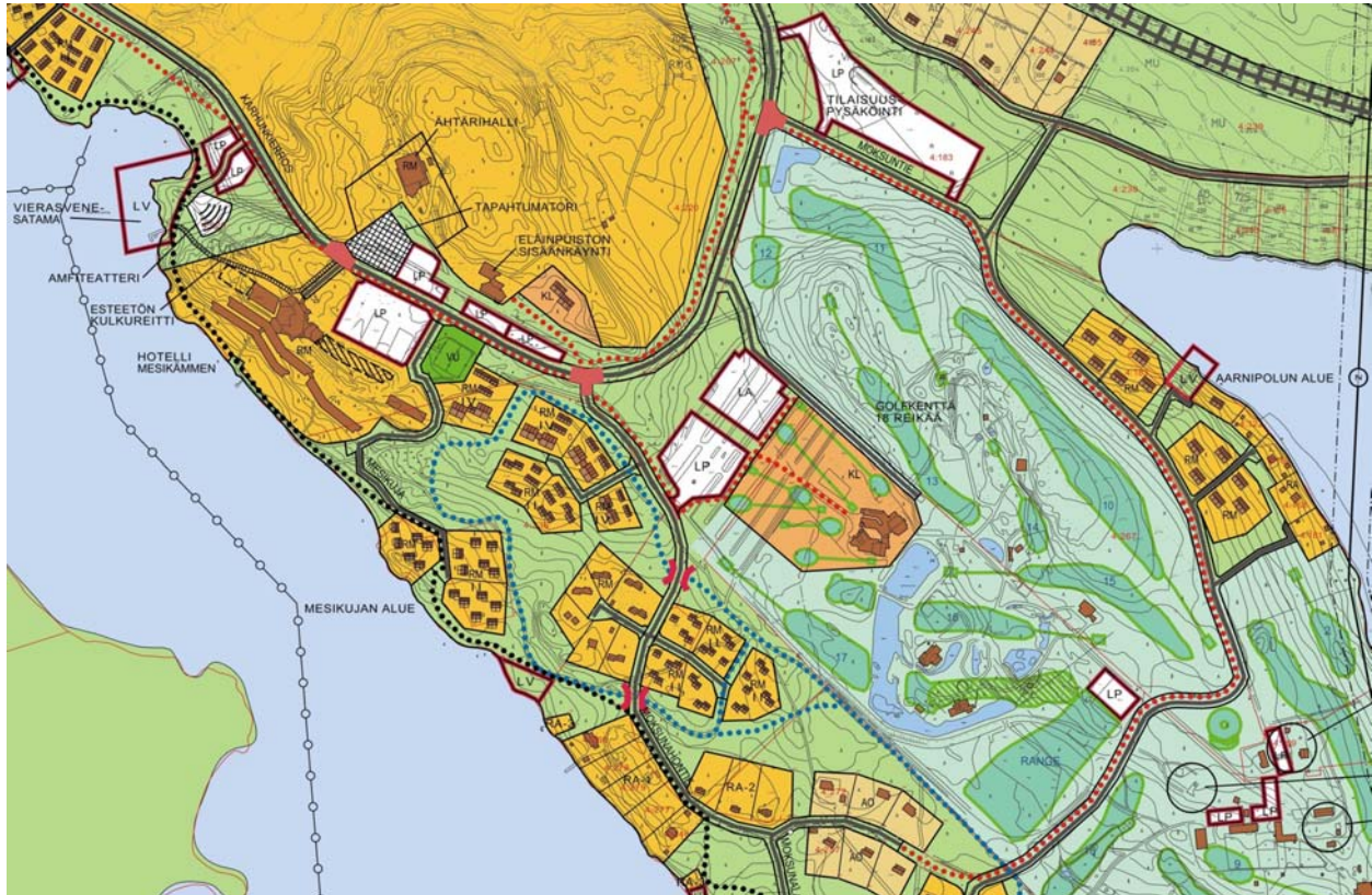
Kuva 3: Ote Moksunniemen yleissuunnitelmasta (2011)

Osayleiskaava perustuu Ähtärin matkailua koskevaan Masterplan-suunnitelmaan (2010), jonka visiona ja tavoitteena on Ähtärin kehittäminen Suomen johtavaksi ympärivuotiseksi perhematkailukeskukseksi vuonna 2020. Osayleiskaavoituksen ja tulevien asemakaavamuutosten pohjaksi on laadittu Moksunniemen loma- ja matkailualueelle yleissuunnitelma (2011), jossa on esitetty toiminnallisia ratkaisuvaihtoehtoja Masterplanin tavoitteiden edellyttämän kerrosalan ja palveluiden sijoittamiseksi Moksunniemen alueelle.