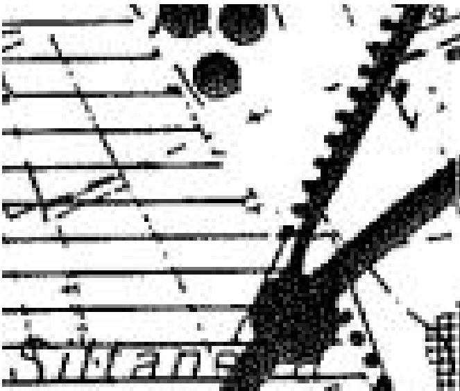
Kuva 3. Ote osayleiskaavasta 1984

Keskustaajaman osayleiskaavojen tarkistus ja laajennus on valmisteilla.