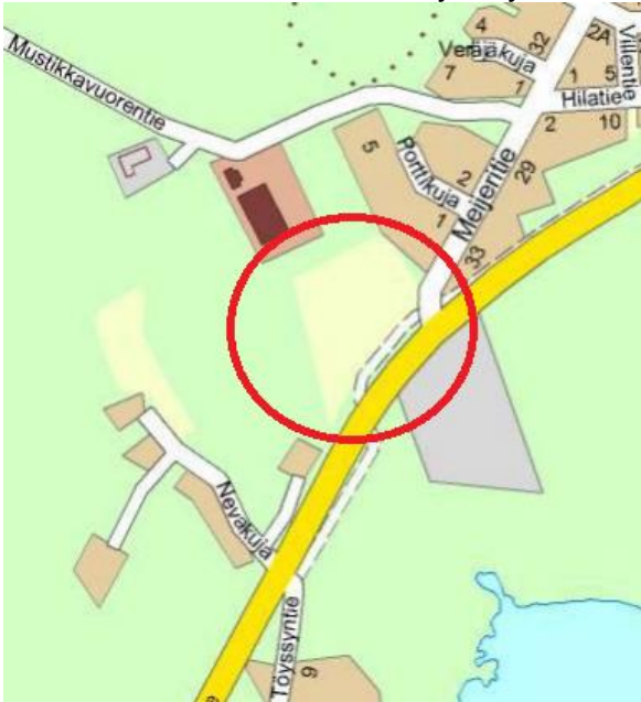
Kuva 1. Suunnittelualueen sijainti

Suunnittelualue muodostuu yksityisen omistamasta tontista Rn:o 7:259.