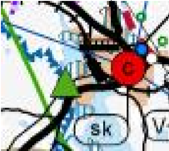
Kuva 2. Ote E-P:n maakuntakaavasta.

Etelä-Pohjanmaan maakuntakaavassa kaavoitettava alue kuuluu taajamatoimintojen alueeseen, jonka tulee edistää yhdyskuntarakenteen tiivistämistä, täydennysrakentamista ja taajamakuvan eheyttämistä. Suunnittelualue kuuluu virkistys-/matkailukohde alueelle. Alue on tarkoitettu virkistystoimintaa ja matkailua tukevaksi kohteeksi, jonne voidaan sijoittaa tarkoitusta tukevia rakennuksia ja rakenteita. Alueella ei ole voimassa MRL 33§:n mukaisista ehdollista rakentamisrajoitusta.