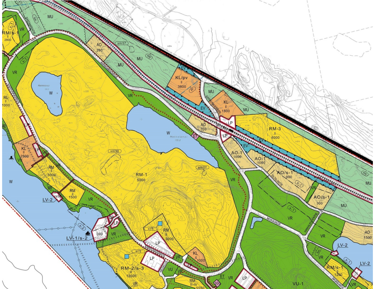
Kuva 2. Ote Moksunniemen osayleiskaavasta, KV 10.2.2014

Alueella on voimassa kaupunginvaltuuston 10.2.2014 hyväksymä Moksunniemen osayleiskaava (kuva 2). Osayleiskaavassa alueelle on osoitettu liikerakennusten aluetta (KL/pv), jolle on merkitty kerrosluvuksi II ja 3800 krs m 2 rakennusoikeutta. Alueen länsiossa sijoittuu pohjavesialueelle (pv). Valtatien varteen meluvyöhykkeelle sekä radan varteen on osoitettu suojaviheralueita (EV). Karhunkierroksen länsipuolelle on osoitettu uusi kevyen liikenteen väylä. Lähiympäristöön on osoitettu liikerakennusten alueen (KL) lisäksi matkailupalvelujen aluetta (RM-3) sekä yleistä pysäköintialuetta (LP) ja maa- ja metsätalousvaltaisia alueita, joilla on erityistä ulkoilun ohjaamistarvetta (MU).