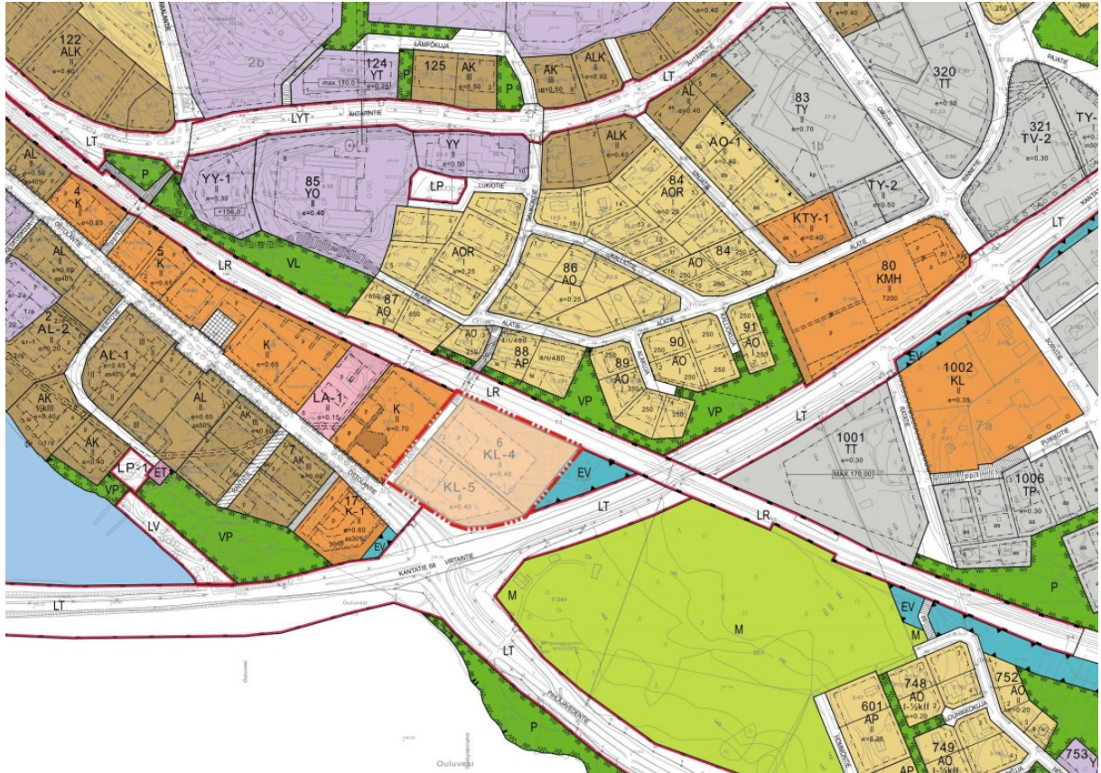
Kuva 2. Ote asemakaavayhdistelmästä ja suunnittelualueen rajaus